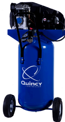
Model Q12126VPQ 2 HP Motor 26 Gallon Tank