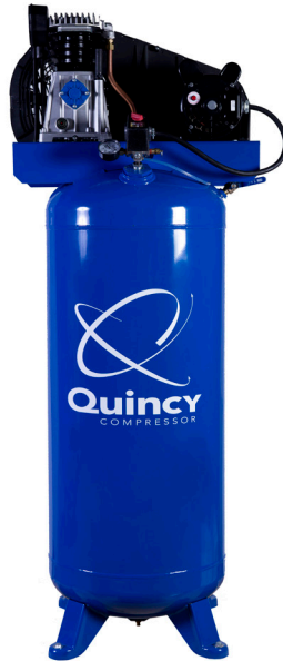
Modelo Q13160VQ Motor 3.5 HP Tanque 60 Galones