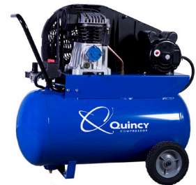
Modelo Q12120PQ Motor 2 HP Tanque 20 Galones