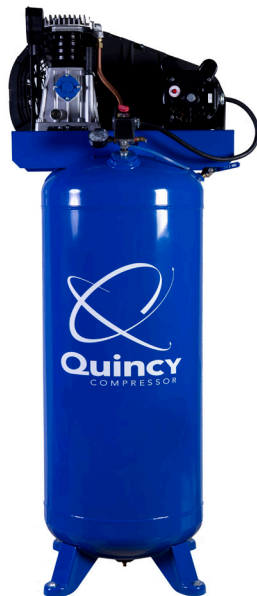
Model Q13160VQ 3.5 HP Motor 60 Gallon Tank